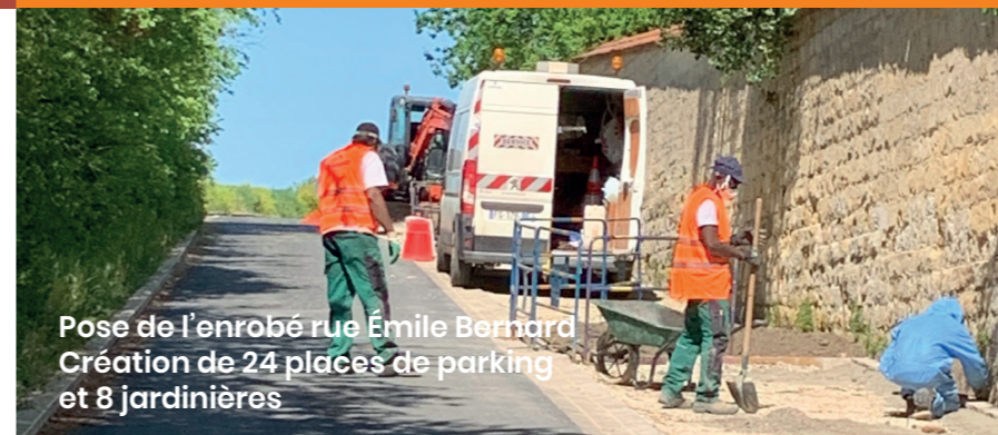
Pose de l'enrobé rue Émile Bernard Création de 24 places de parking et 8 jardinières