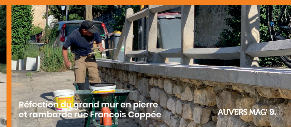
Réfection du grand mur en pierre et rambarde rue François Coppée