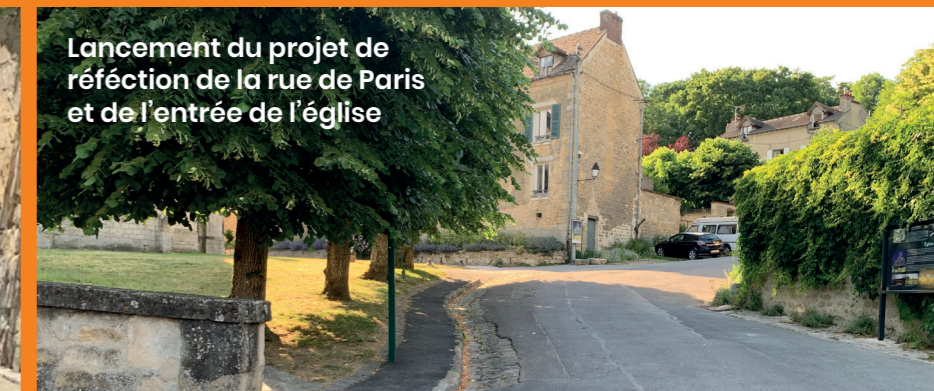
Lancement du projet de réfection de la rue de Paris et de l'entrée de l'église