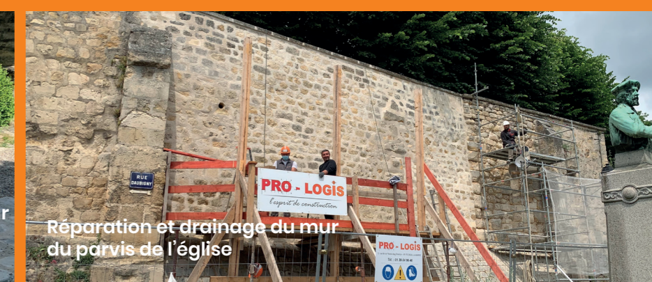
Réparation et drainage du mur du parvis de l'église