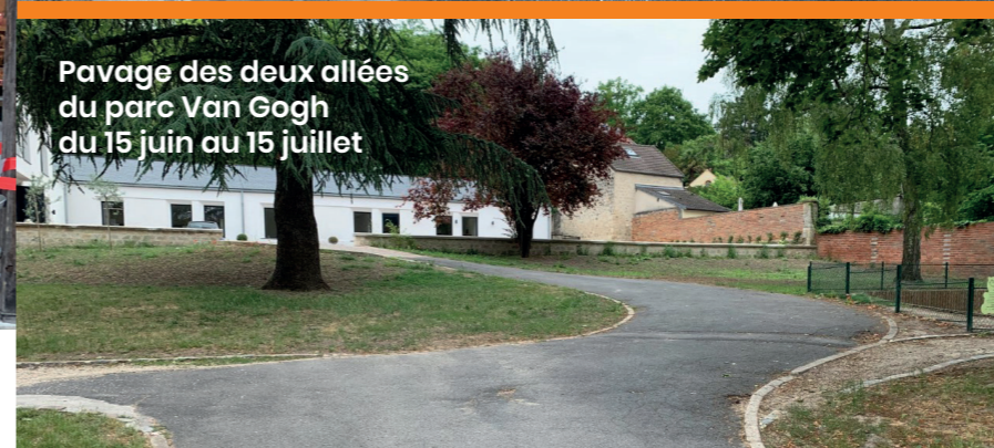
Pavage des deux allées du parc Van Gogh du 15 juin au 15 juillet