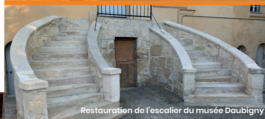
Restauration de l'escalier du musée Daubigny