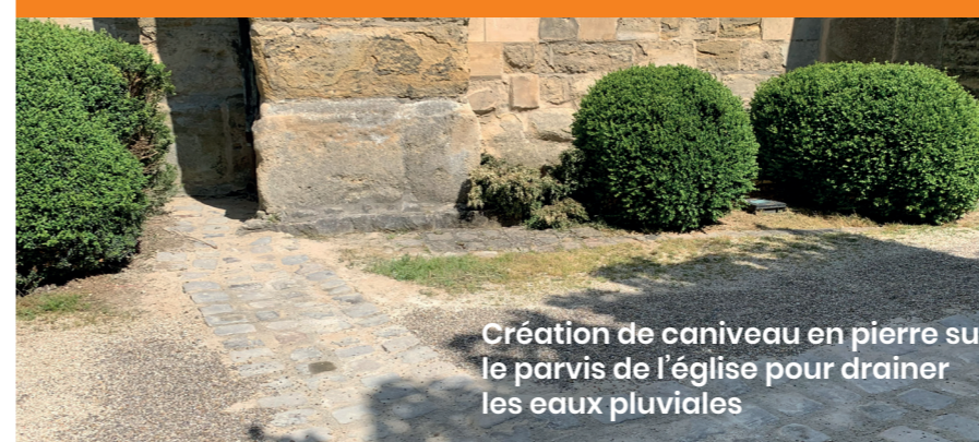
Création de caniveau en pierre sur le parvis de l'église pour drainer les eaux pluviales