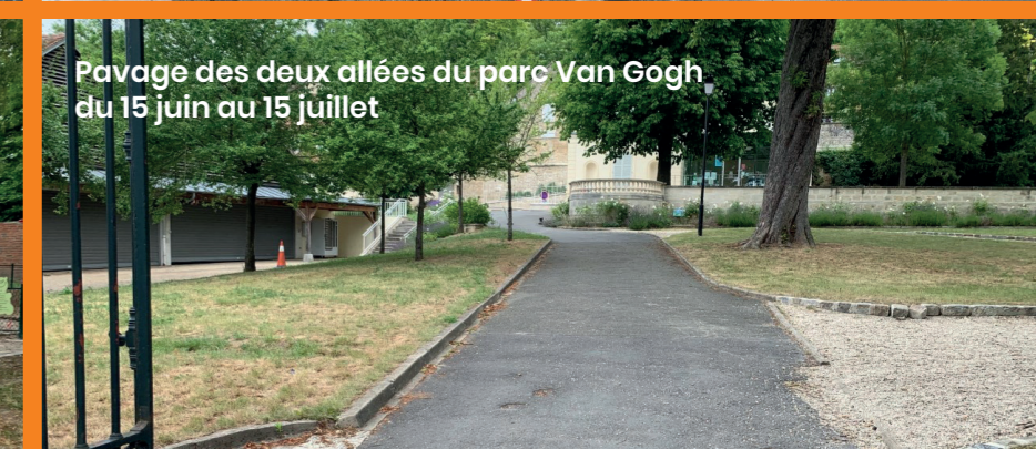
Pavage des deux allées du parc Van Gogh du 15 juin au 15 juillet