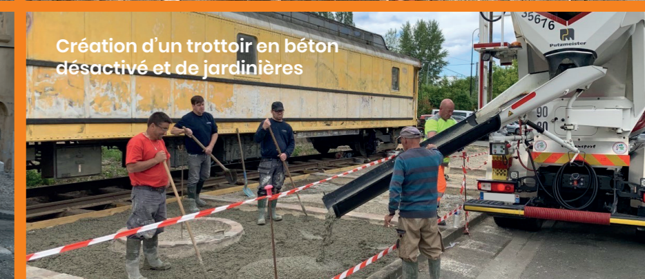
Création d'un trottoir en béton désactivé et de jardinières