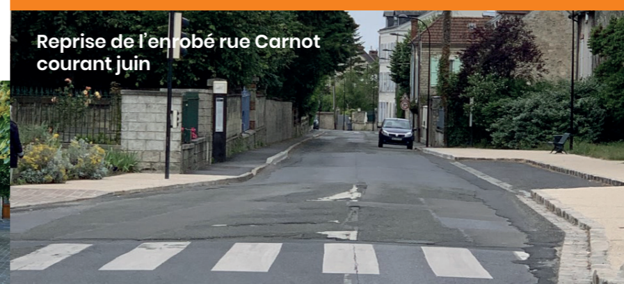
Reprise de l'enrobé rue Carnot courant juin